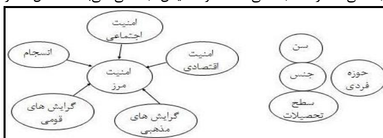
شکل ۲- مدل مفهومی تحقیق

روش تحقیق این پژوهش از نوع توصیفی - تحلیلی است و جهت جمع‌آوری داده‌ها و اطلاعات از دو شیوه اسنادی و میدانی بهره گرفته شده است و با استفاده از پرسشنامه محقق ساخته داده‌های مورد نیاز گردآوری شد. پایایی آن نیز بر اساس روش اندازه‌گیری آلفای کرونباخ برابر با ۰/۸۴۱ محاسبه شد که مطلوب بحساب می‌آید. جامعه آماری ۲۶۰۱۰ خانوار و جامعه‌ی نمونه بر اساس فرمول کوکران ۳۸۰ خانوار انتخاب گردیده است. برای جمع‌آوری اطلاعات از شیوه‌های جاری همانند اطلاع‌یابی از طریق ریش سفیدان، شوراها، دهیاران و معتمدان روستا بدون اینکه زمینه جریحه‌دار شدن احساسات را فراهم نماید، بهره گرفته شده است. برای سنجش انسجام اجتماعی از سه شاخص ۱- گرایش شیعه و سنی منطقه به یکدیگر ۲- میزان تعامل اجتماعی آنها با یکدیگر ۳- میزان نزاع‌های جمعی میان آنها استفاده گردیده است. متغیرهای مورد بررسی در تحقیق شامل؛ داشتن فامیل نزدیک (پدر، مادر، خواهر، برادر، همسر)، تعلق مکانی، تعامل مذهبی - قومی، بیگانه نبودن، رضایتمندی، آسودگی خاطر، انسجام اجتماعی، مشارکت اجتماعی، اعتماد و اطمینان اجتماعی، می‌باشد. (شکل شماره ۱).