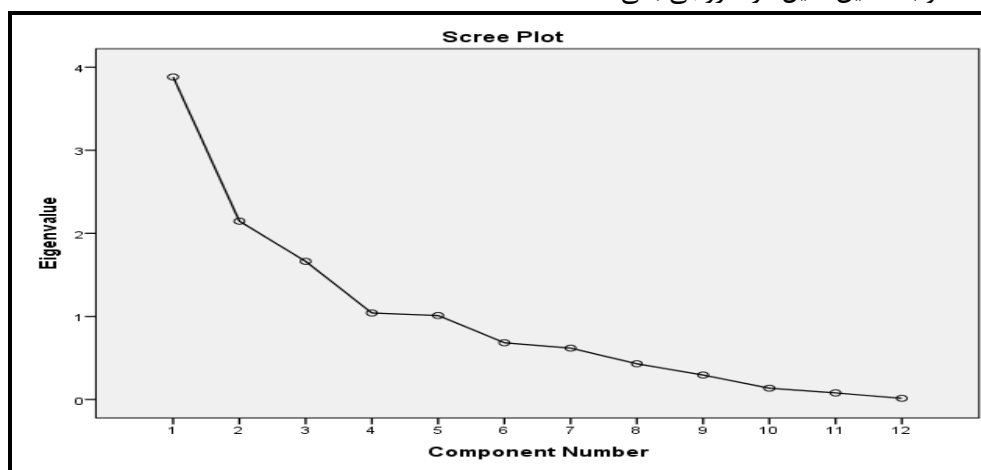
شکل ۲- تصویر گرافیکی مقدار ویژه

نمودار تصویر گرافیکی مقدار ویژه در هر یک از عامل های استخراجی شده است (Police Station, 1382: 112). مقدار واریانس توجیه شده (مقدار ویژه) با استخراج عامل های بعد از عامل سوم به سرعت افت می کند مقادیر ویژه عامل های اول تا سوم بیشتر از یک است و به همین دلیل در خروجی باقی مانده اند.